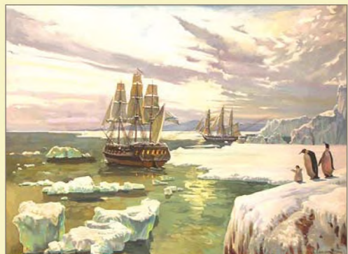
Экспедиция Беллинсгаузена и Лазарева. У материка Антарктида. 1820 г.

200 лет назад русские мореплаватели открыли Южный материк